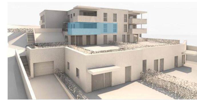
lage im gebäude